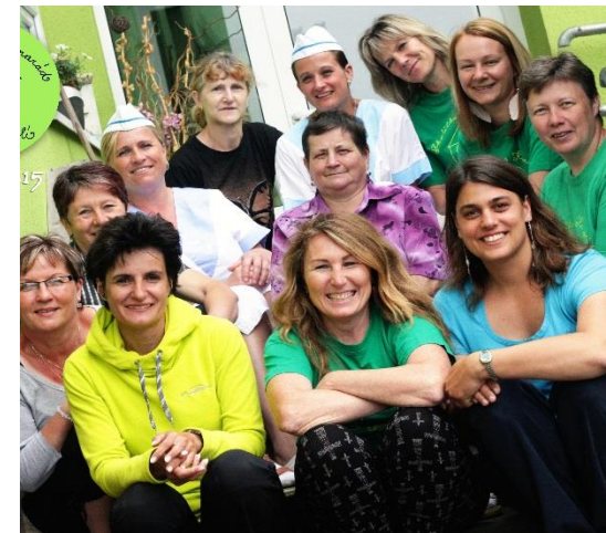
Zelený tým Školičky Kamarád