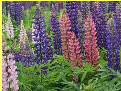
VLČÍ BOB LUPINA